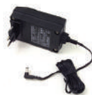
CARGADOR DE BATERÍA

La barra abrazadera integrada sujeta la silla durante el transporte