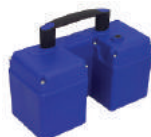
UNIDAD DE BATERÍA