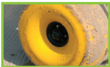
Ruedas especiales para diferentes terrenos