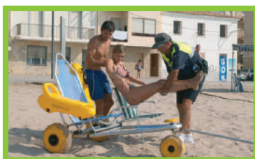
Debe ser utilizada con asistencia