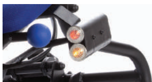
KIT DE LUCES