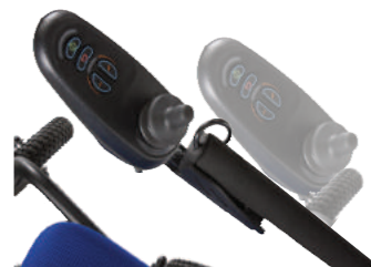
JOYSTICK CON POSIBILIDAD DE CIERRE