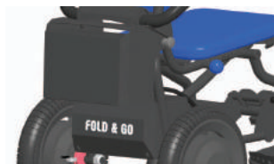
BATERÍAS ADICIONALES (+ 10KM)