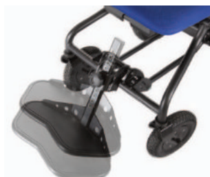
REPOSAPIES ALTURA AJUSTABLE